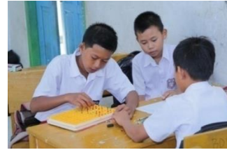
Gambar 4. Peserta didik Mencoba Menerapkan Alat Peraga “Paper dan Nokrumtul” secara Berkelompok

Penerapan alat peraga “Paper dan Nokrumtul” pada pembelajaran matematika dalam materi perpangkatan dan akar sederhana di kelas V SD.